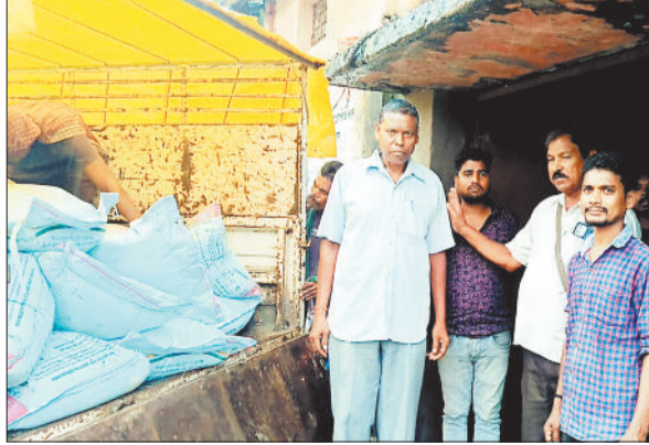
किसानों को कृषक उन्नति योजना का लाभ मिलेगा, इसका किसानों ने स्वागत करते हुए कहा कि इस निर्णय से छत्तीसगढ़ में खेती का दायरा बढ़ेगा और किसान समृद्ध होंगे। सहकारिता विभाग से मिली जानकारी के अनुसार किसान खाद और बीज लेने के लिए तपकरी, कांसाबेल, चांदीरबाहर, और कुनकुरी सहकारी समिति पहुंचे थे जहां किसान ने खाद का उठाव किया गया।

जशपुरनगर। किसानों के लिए खेती बाड़ी का सीजन चालू हो गया है। मुख्यमंत्री विष्णुदेव साय ने सभी किसानों को खाद और बीज समय पर उपलब्ध कराने के निर्देश दिए हैं। जिले के सहकारी समितियों के माध्यम से खाद और बीज प्राथमिकता के साथ उपलब्ध करा रही है। इसके अलावा अल्पकालिन ऋण की सुविधा मुहैया करा रही है, ताकि किसान वर्ग निश्चित होकर खेती कर सकें। राज्य सरकार द्वारा किसानों के हित में लिए गए निर्णयों की वजह से उनमें खेती के लिए अलग ही उत्साह भी नजर आ रहा है। छत्तीसगढ़ शासन द्वारा किसानों को अब धान के बदले दलहन, तिलहन, मक्का आदि के फसल लगाने वाले