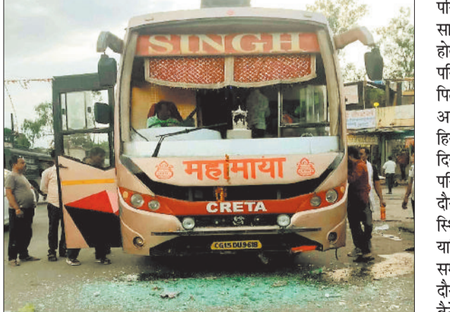
है जिससे उसे सिर व शरीर के अन्य हिस्सों में चोटें आई हैं। प्रत्यक्षदर्शियों ने बताया कि मौके पर उतावत मचा रहे युवक बस के परिचालक को खोजते

बिभ्रामपुर। बिभ्रामपुर बस स्टैंड में आधा दर्जन बदमाश युवकों ने बुधवार की शाम करीब साढ़े पांच बजे