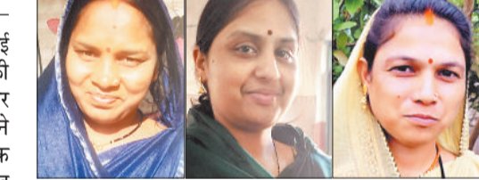
लाखों महिलाओं का बदल रहा है जीवन, व्यवसाय कर बन रही आत्मनिर्भर

छत्तीसगढ़ सरकार द्वारा शुरू की गई महतारी वंदन योजना प्रदेश की महिलाओं के सामाजिक, आर्थिक और पारिवारिक जीवन में बदलाव लाने वाली एक क्रांतिकारी पहल बनकर उभरी है। यह योजना केवल आर्थिक सहयोग का माध्यम नहीं है, बल्कि महिलाओं को आत्मनिर्भर और सम्मान जनक जीवन देने की दिशा में एक मजबूत प्रयास है। ऐसे अनेकों उदाहरण हैं जिनकी जिंदगी इस योजना के माध्यम से बदली है। महतारी वंदन योजना द्वारा जिले में 2 लाख से अधिक महिलाओं को योजना की शुरूआत मार्च 2024 से जून 2025 तक 342 करोड़ 39 लाख 31 हजार 950 की राशि प्राप्त हो चुकी है।