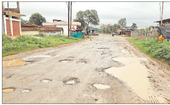
सड़क पर गड्डे ही गड्डे।

पथलगांव। जिले के पथलगांव से किलकिला होकर कापू जाने वाली सड़क की हालत काफी जर्जर हो गई है। जगह-जगह सड़क बड़े-बड़े जगहों पर टूट चुके हैं। बरसात में पानी भरने के कारण यहां दुर्घटना की आशंका भी बढ़ गई है। सड़क की इस स्थिति से नागरिक खास नाराज हैं। कई बार संबंधित अधिकारियों के पास गुहार लगाने के बावजूद भी सड़क नहीं सुधर पाई है।