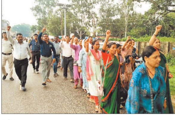
रैली में शामिल शिक्षक।