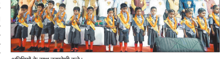
अतिथियों के साथ नवप्रवेशी बच्चे।