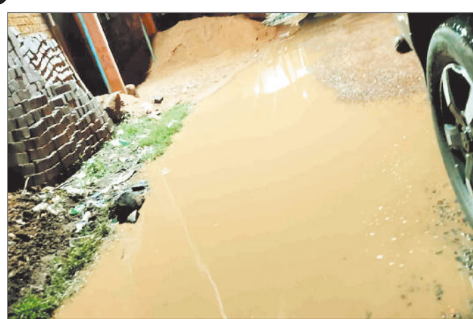
सड़क पर जमा पानी।

पुराना बस स्टैंड से देवरी पहुंच मार्ग में पानी का जमाव होने से क्षेत्र के लोगों के अलावा वाहन चालक सहित राहगीर परेशान है। हैरानी की बात तो यह है पी एम जी ए स वाई सड़क तो बनाया गया लेकिन नाली निर्माण नहीं होने से बारिश होते ही सड़क पर ही पानी एकत्र हो जाती है जिससे लोगों को आवागमन करने में